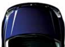
Velvet Indigo Blue