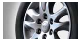
235 / 60 R17