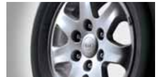
225 / 70 R16